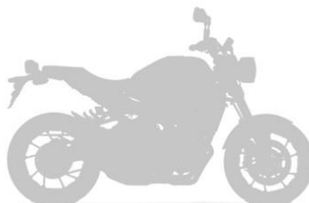
WANXIN COBRA 150 2023