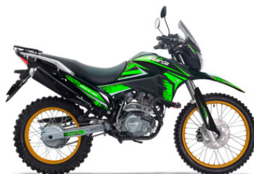
NEGRO / VERDE