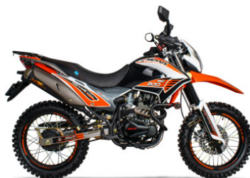
NEGRO / NARANJA